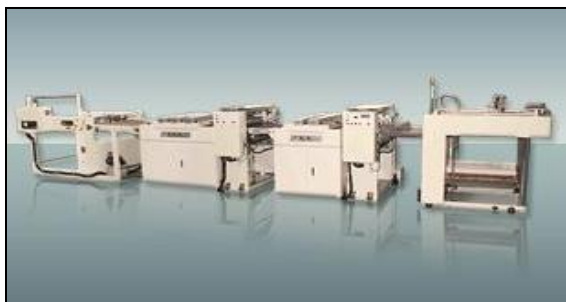
装置外観 (UVニス用リバースコーター)