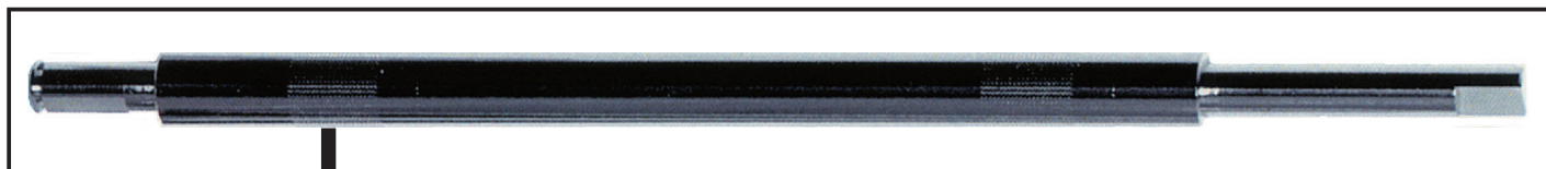
グリッドローラー