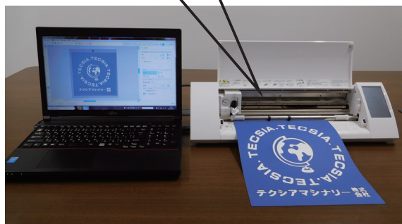
カッティングマシン